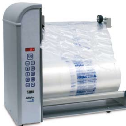
AIRplus® GTI avec 400mm largeur de film.

Sur le plan ergonomique, ces machines offrent l'avantage de pouvoir être montées directement sur la chaîne. Un conseiller en emballage Storopack vous aidera à définir l'endroit le plus adapté pour le placement et l'intégration de cette machine dans votre processus. L'alimentation peut aussi se faire non pas à l'aide du capteur, mais à l'aide d'une pédale. Et, en tout cas, l'opérateur garde ses deux mains libres pour couper le film à la longueur souhaitée et ainsi assurer l'emballage optimal des marchandises.