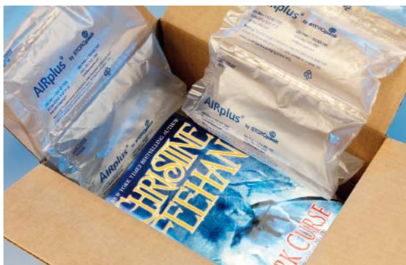
Exemple d' emballage avec AIRplus® Void film.