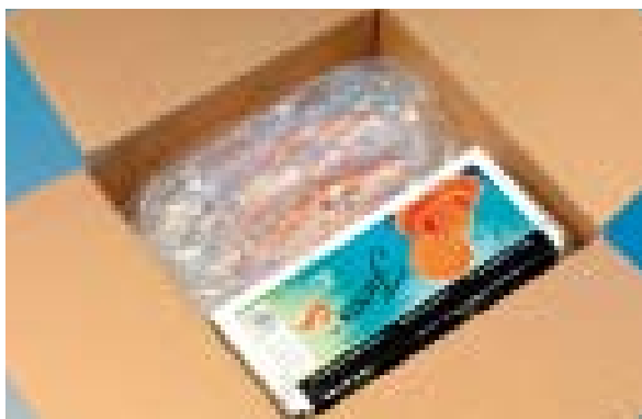
Exemple d' emballage avec AIRplus® Cushion film.

Pour toute information complémentaire, veuillez prendre contact: