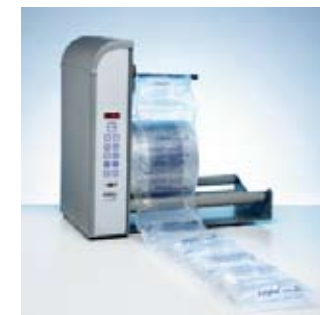
AIRplus® GTI avec 200mm largeur de film.