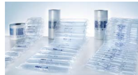
AIRplus® film de Storopack.

AIRplus® GTI accepte l'ensemble de la gamme des films Airplus. Il existe des formats et formes de coussins pour chaque application, du remplissage des creux à l'enveloppement et au rembourrage.